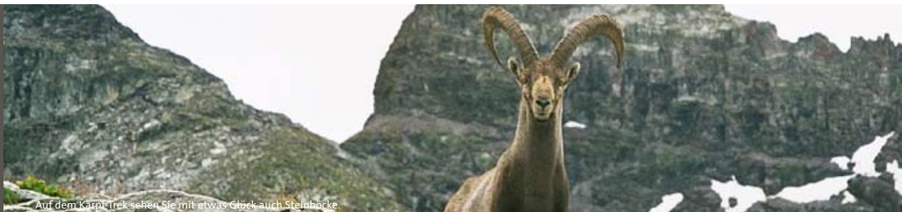
Auf dem Kärf-Trek sehen Sie mit etwas Glück auch Steinböcke.

1 Staumauer «Garichte», Wasserkraft 1929 wurde die Kraftwerke Sernf-Niedererbach AG (SN) durch die Stadt St. Gallen und die Gemeinde Schwanden gegründet. Von 1929 bis 1931 erfolgte der Bau des Kraftwerkes in Schwanden sowie der Staumauer auf Mettmen. Später stiessen weitere Partner dazu: die Stadt Rorschach, das Elektrizitätswerk (EW) Jona-Rapperswil, die Stadtwerke Arbon, das EW Romanshorn und das EW Wald ZH. Die SN Energie AG schreibt in ihrer Website: «Mit unseren eigenen Wasserkraftwerken am Sernf, Niederen- und Leuggelbach im oberen Glarnerland decken wir einen bedeutenden Teil unseres Energiebedarfs ab, insbesondere die wertvolle Spitzenenergie. Die installierte Leistung beträgt beim Kraftwerk Niedererbach 33,5 MW und beim Kraftwerk Sernf 16,5 MW. Beide Generatoren sind in der Zentrale in Schwanden untergebracht. Das Kraftwerk Leuggelbach hat eine Leistung von 1 MW.»