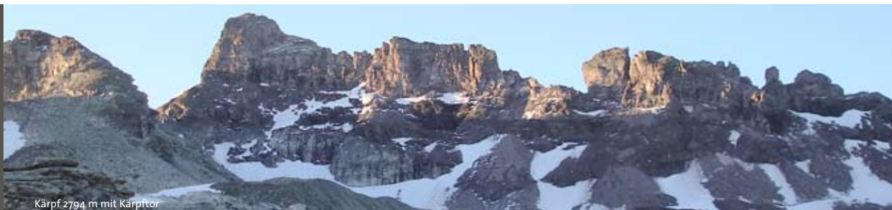
Kärpf 2794 m mit Kärpftor